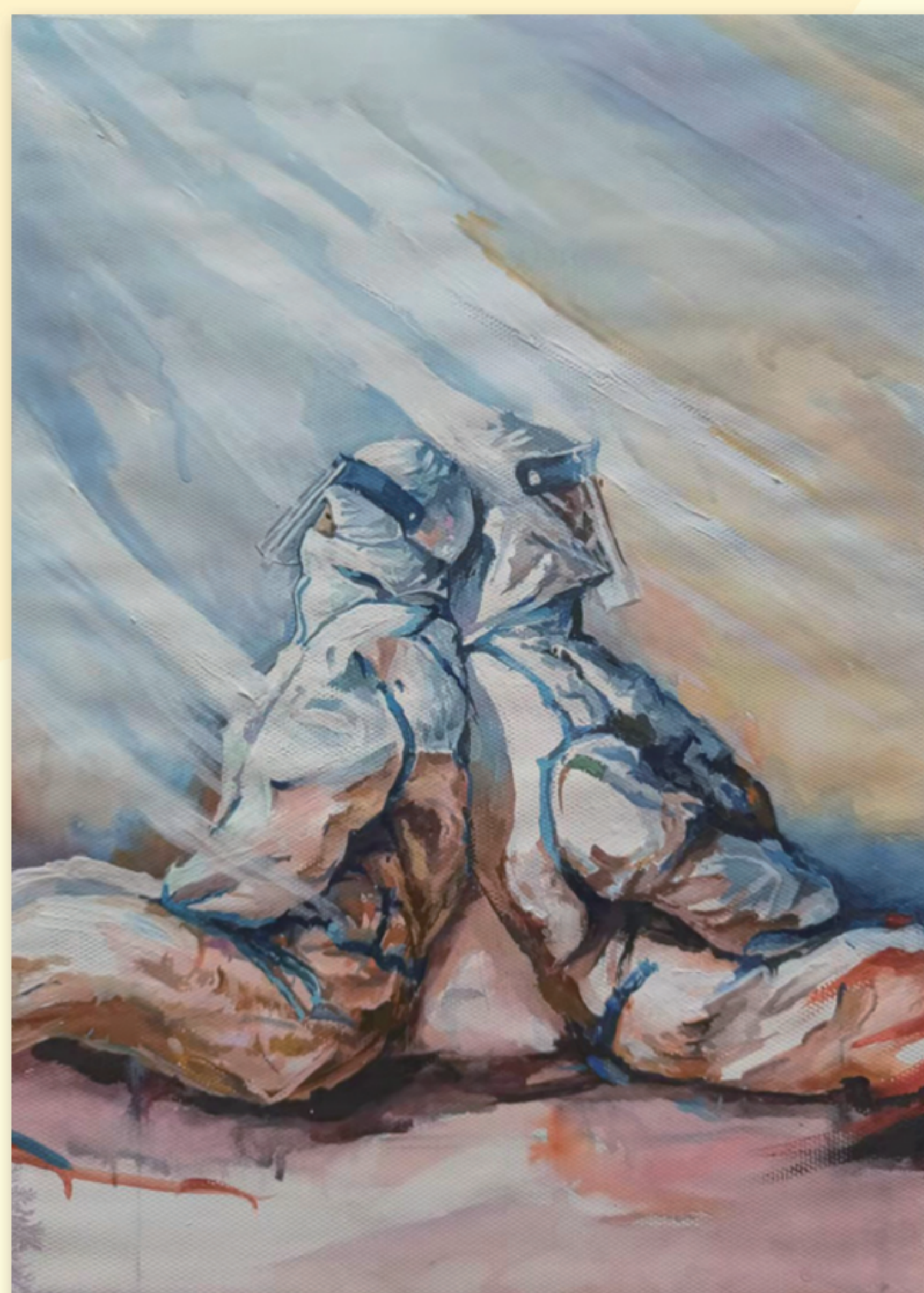
《同心抗疫 相偎相依》 柴英铭