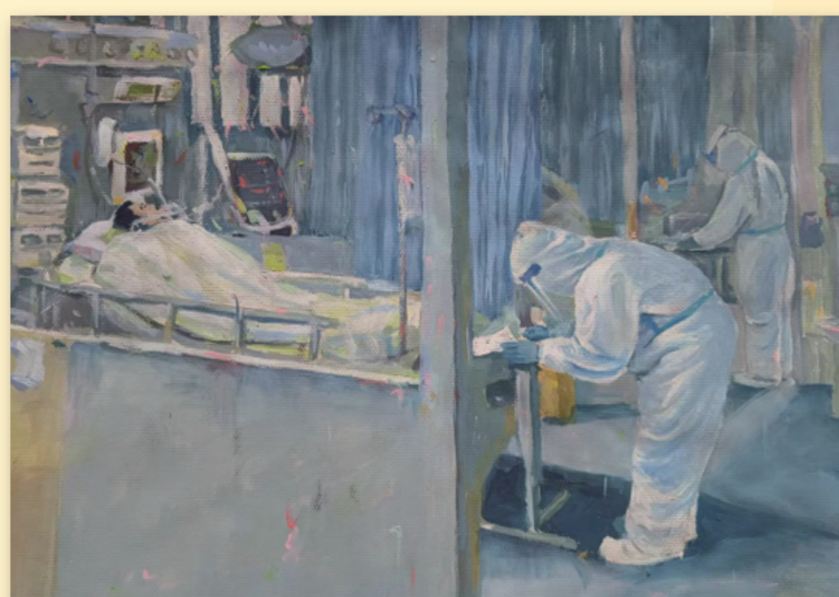
《同心抗疫 光明使者》 任平