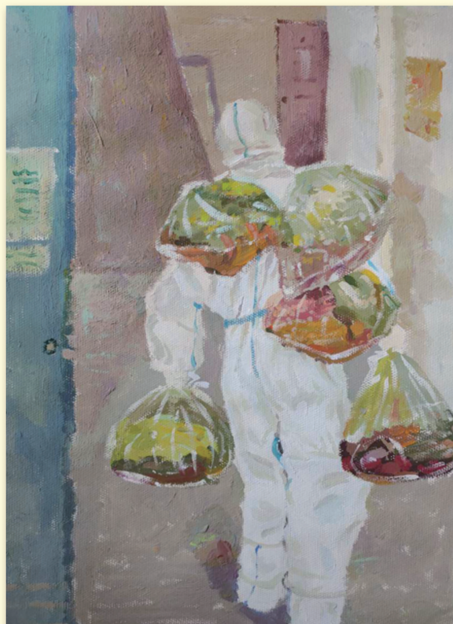
《同心抗疫 雪中送炭》 黄飞